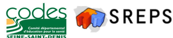
Schéma Régional d'Education pour la Santé d'Île-de-France

Université Paris 13 – UFR de Santé, Médecine et Biologie Humaine 74 rue Marcel Cachin 93017 Bobigny Tél./Fax : 01 48 38 77 01 -Mél. : codes93@codes93.org